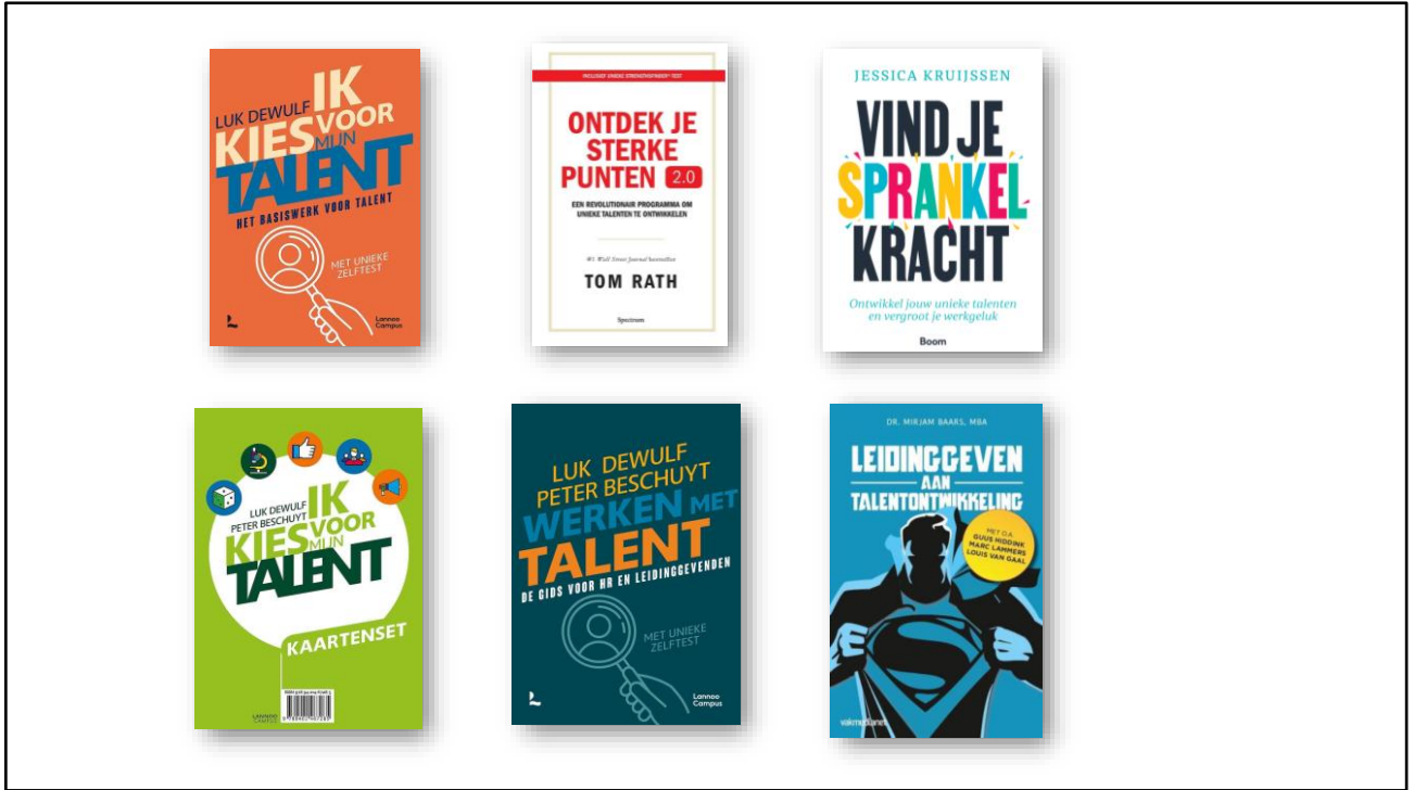
Leestips + kaartenset Luk DeWulf (bol.com)